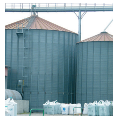
Ets Poncet 2

Ce bâtiment est aujourd'hui la mairie, uniquement.