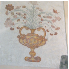
Intérieur 10 église

Faites demi-tour et descendez dans le centre du bourg (par la montée de l'église). Dirigez-vous à gauche, traversez à nouveau la route départementale pour retrouver le parking de la mairie (en face).