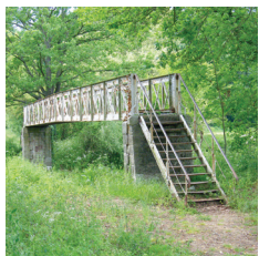
Pont 8 métallique

Arrivé au tourniquet, tournez à gauche, vous arrivez au pont de la rivière Coise. Jusqu'en 1900, une passerelle en bois, souvent emportée par les crues permettait aux piétons de franchir le cours d'eau. Elle fut remplacée par un pont métallique, qui fut démonté en 1983 pour faire place au pont actuel.