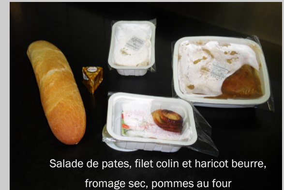
Salade de pâtes, filet colin et haricot beurre, fromage sec, pommes au four