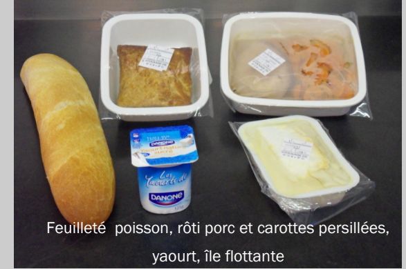
Feuilleté poisson, rôti porc et carottes persillées, yaourt, île flottante