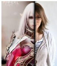
© Douut.San - Calligraphie des Lumières