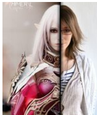
© Douut.San - Calligraphie des Lumières

Manga, films de super-héros, dessins animés,... Partez à la découverte du monde du cosplay au travers d'une exposition de 14 costumes confectionnés par les élèves de 2 nd e Métiers de la mode du lycée des Monts du Lyonnais.