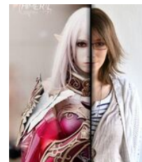
Calligraphie des Lumères